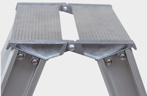
Detail Deckstufe mit Gussgelenk und Griffschlitz