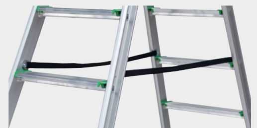
Detail Spreizsicherung (Gurt)