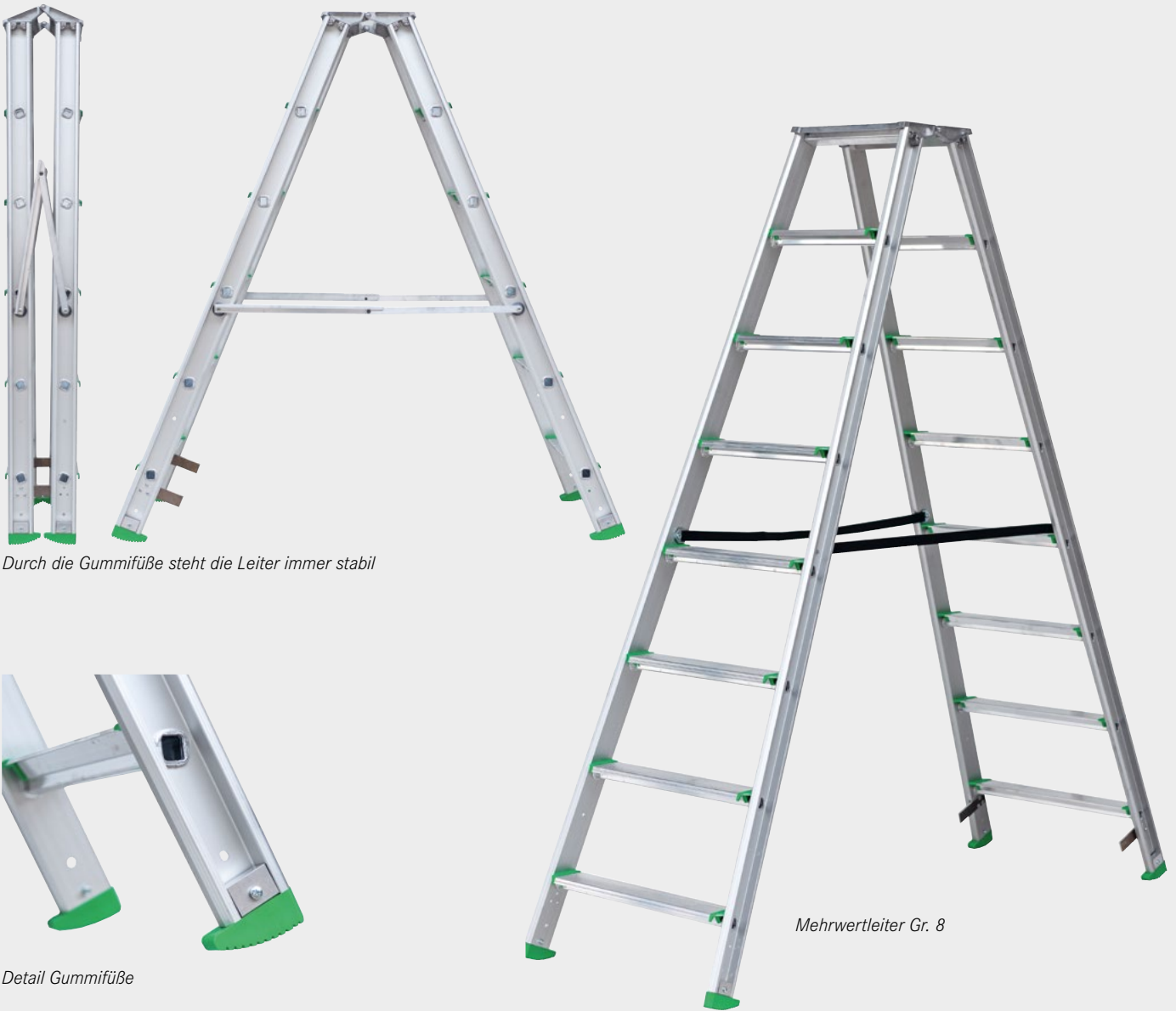
Durch die GummifüÙe steht die Leiter immer stabil