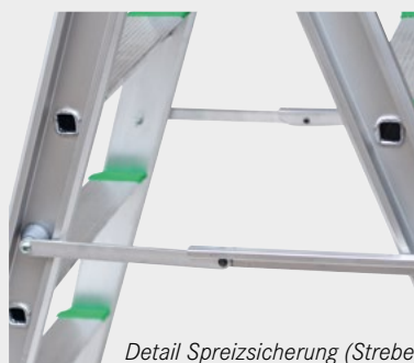
Detail Spreizsicherung (Strebe)